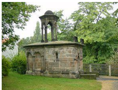
Das heilige Grab